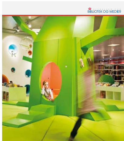
Folke- og Forskningsbiblioteksstatistik 2007

Folke- og Forskningsbiblioteksstatistik 2007 er publiceret ultimo juni 2008. Publikationen kan hentes på www.bibliotekogmedier.dk .