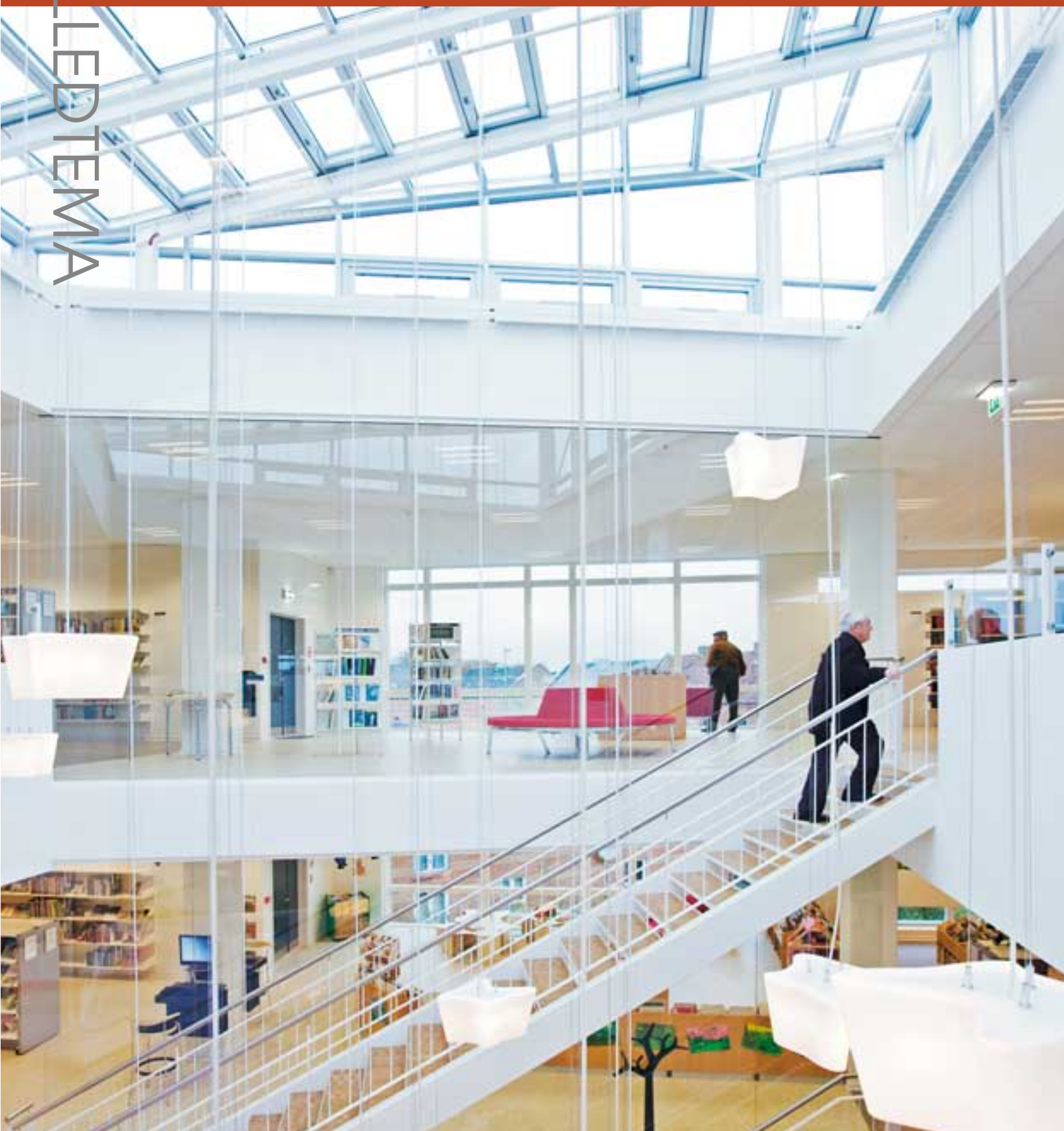
Et kig fra 2. sal, det sjette rum, og ned mod børnebiblioteket, det andet rum.