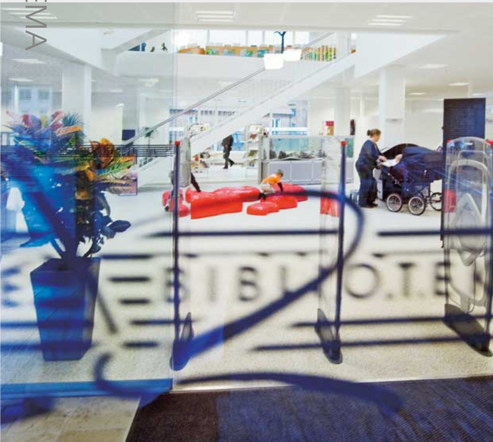
Det første rum, InfoPunkt, er ankomst- og velkomstrådet. Dette rum er en appetitvækker med café, info, udstillings- og internetområde samt selvbetjeningsfaciliteter.