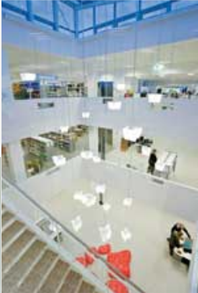
23 'cookie-formede' lamper, som er fremstillet i et samarbejde mellem Krabbesholm Højskole og Louis Poulsen, hænger i den centrale lysåbning ved trappen.

momentum skal vi da prøve at skabe og udnytte. Vi skal ikke sidde og vente på, at nogen opdager, at herude på ydre Østerbro findes der faktisk et blindebibliotek, der kan noget. Det skal vi selv ud at fortælle.